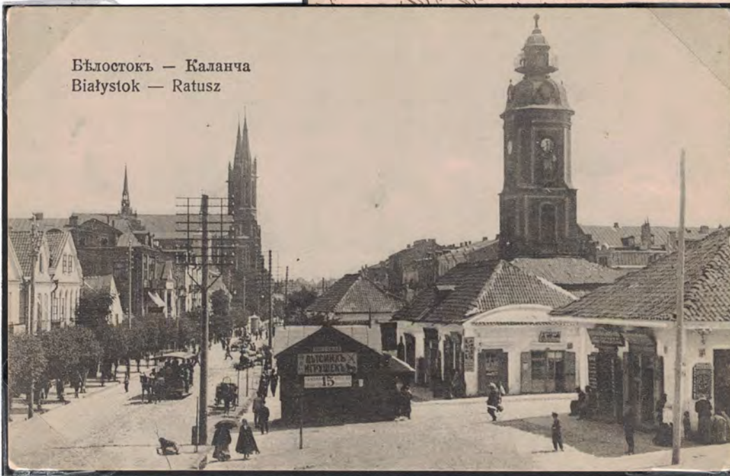
Бѣлостокъ — Каланча Białystok — Ratusz