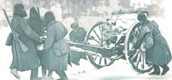
Советские войска на улицах освобождённого г. Калинина. 1941 г.

70 лет со дня освобождения от немецко-фашистских войск