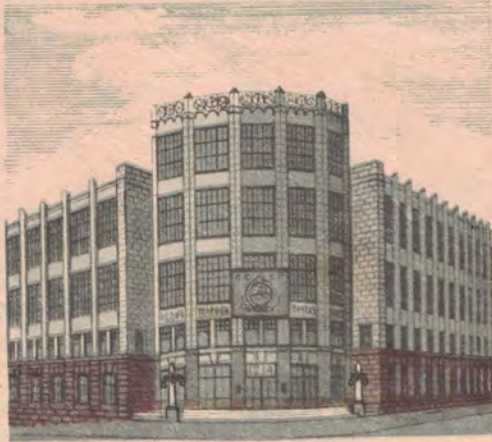
Москва. Здание центрального телеграфа.