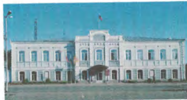
г. Троицк, Челябинская область

Челябинская область ул. Климова, 7 АДМИНИСТРАЦИЯ г. Троицка