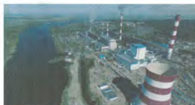
г. Троицк, Челябинская область

Отправитель МАЛ ПАО ОГК-9 Адрес ТРОИЦКАЯ ГРЭС ЧЕЛЯБИНСКАЯ ОБЛАСТЬ Телефон 457105 г. ТРОИЦК-8 Индекс