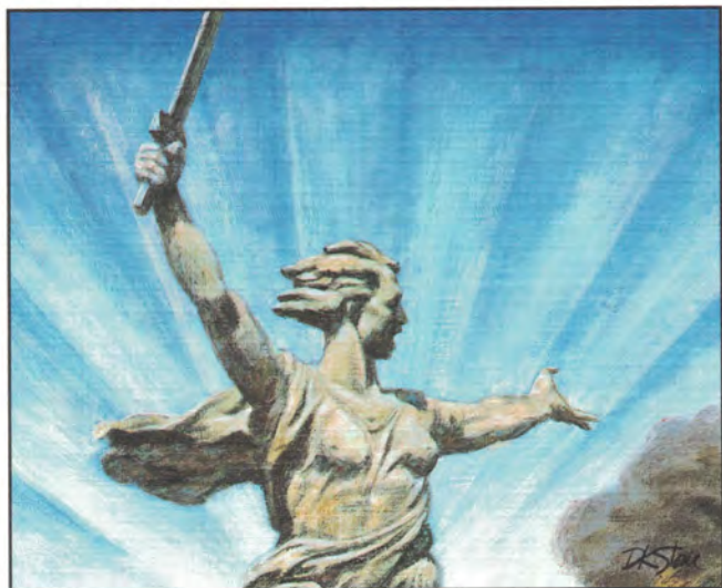
Battle of Stalingrad August 23, 1942

MARSHALL ISLANDS Battle of Stalingrad 1942