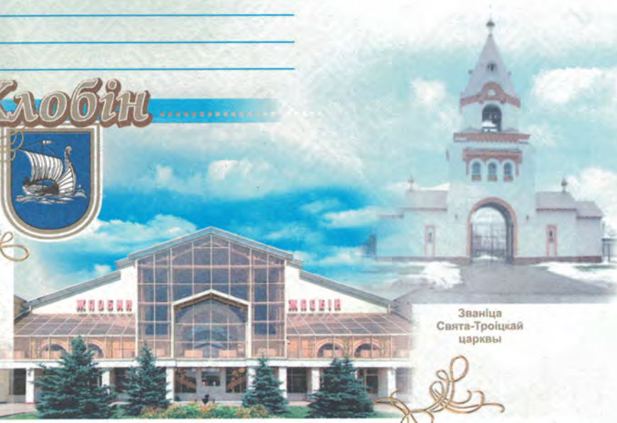
Званіца Свята-Троіцкай царквы