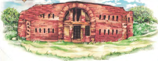
Фрагмент Бабруйскай крэпасці