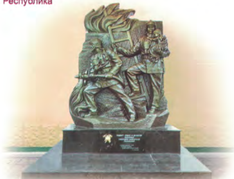
г. Нальчик. Памятник пожарным