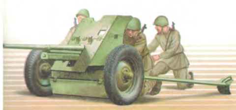
45-мм противотанковая пушка (53-К)