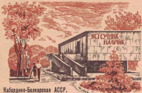
Кабардино-Балкарская АССР. Нальчик.