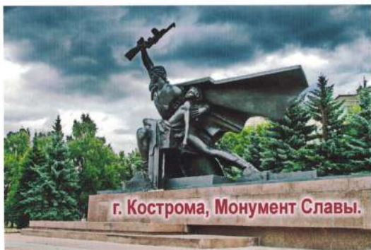
г. Кострома, Монумент Славы.