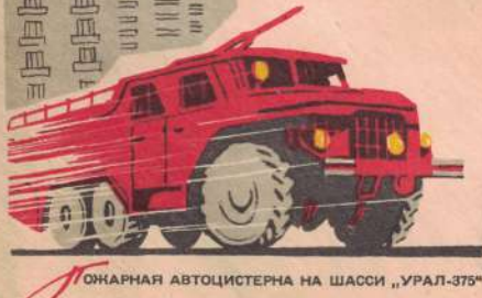
ПОЖАРНАЯ АВТОЦИСТЕРНА НА ШАССИ „УРАЛ-375“

Адрес отправителя Л-9 Оп-13 Засорозинский 47 Вильнюс Литва