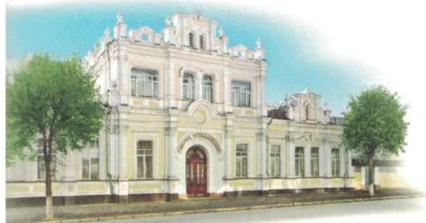
г. Смоленск. Дом городского головы А.П. Энгельгардта. 1879 г.

Кому Главное управление МЧС России по Смоленской области