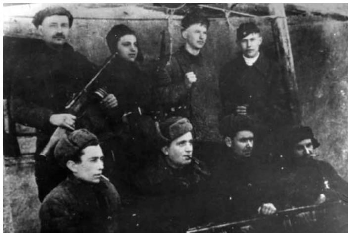
Члены партизанского отряда им. С.М.Кирова

В сентябре 1942 года был создан штаб партизанского движения, численностью 86 партизанских отрядов, входивших в 7 партизанских соединений, или кустов. Они дислоцировались в горно-лесистой местности, в плавнях и